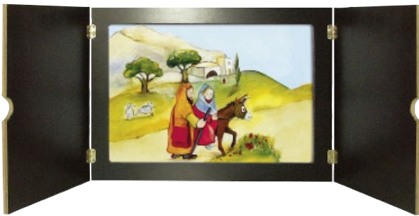
Erzähltheater Kamishibai EAN: 426017951 039 7